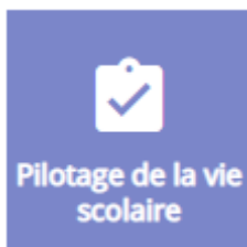
Tableau de pilotage